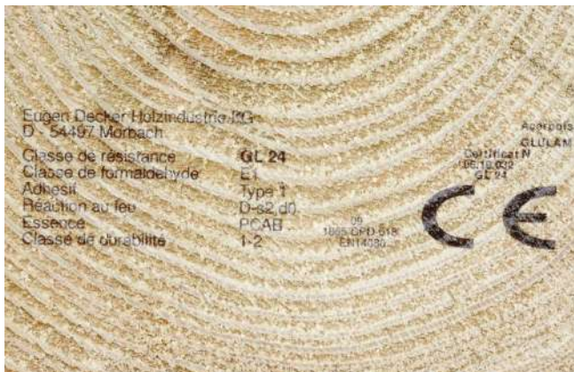
Beschriftung von Holz