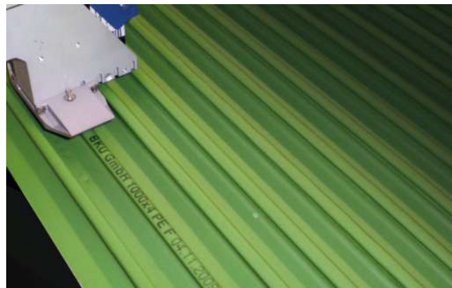
Kennzeichnung von Kunststoffprofilplatten

WILUX PRINT AG Unterfeldstrasse 5 CH-8340 Hinwil