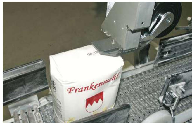
Beschriftung von Mehlütten