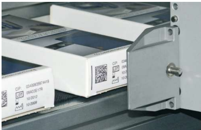
Faltschachtelkennzeichnung mit DataMatrix Code