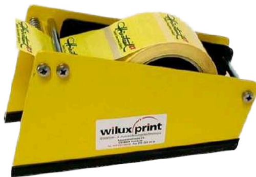
Einbahn. mech. Handspender MR112/1

WILUX PRINT AG Unterfeldstrasse 5 CH-8340 Hinwil