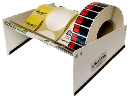
Dreibahn. mech. Handspender MR112/3